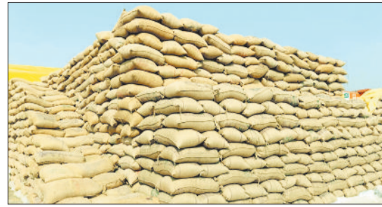
धान खरीदी केन्द्र।

कोरिया जिले में पर्यटन की अपार संभावनाओं की सिर्फ बातें ही होती रही हैं। जिले में पर्यटन विकास को लेकर केवल सीमित केन्द्रों में ही पर्यटन विकास दिखाई देता है, जबकि कोरिया जिले में सचमुच में पर्यटन की अपार संभावनाएँ तो हैं। लेकिन इसके लिए जिले के पर्यटन संभावनाओं वाले स्थलों को चिह्नित कर विकास करने की जरूरत है। आज जिले में कई ऐसे ऐतिहासिक महत्व के स्थल संरक्षण की बाट जोह रहे हैं, जिन्हें संरक्षित कर सड़क पहुँच मार्ग के साथ मूलभूत सुविधाओं का विस्तार किया जाता है तो निश्चित रूप से कोरिया का गौरव गाथा दूर-दूर तक पहुँचाने और क्षेत्र के लोगों को रोजगार के अवसर भी मिलेंगे।